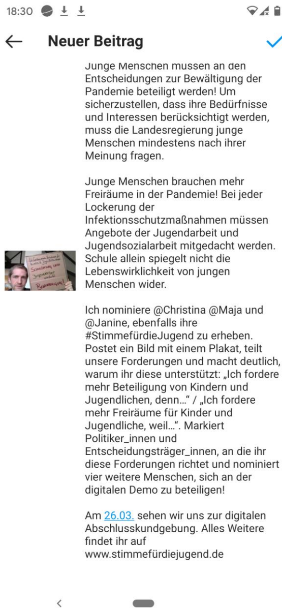
Bild herunterladen, auswählen und den Text einfügen